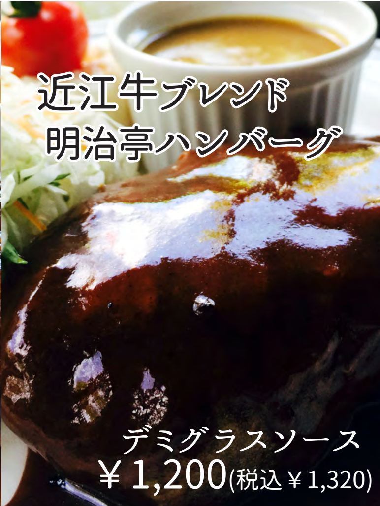
近江牛ブレンド 明治亭ハンバーグ