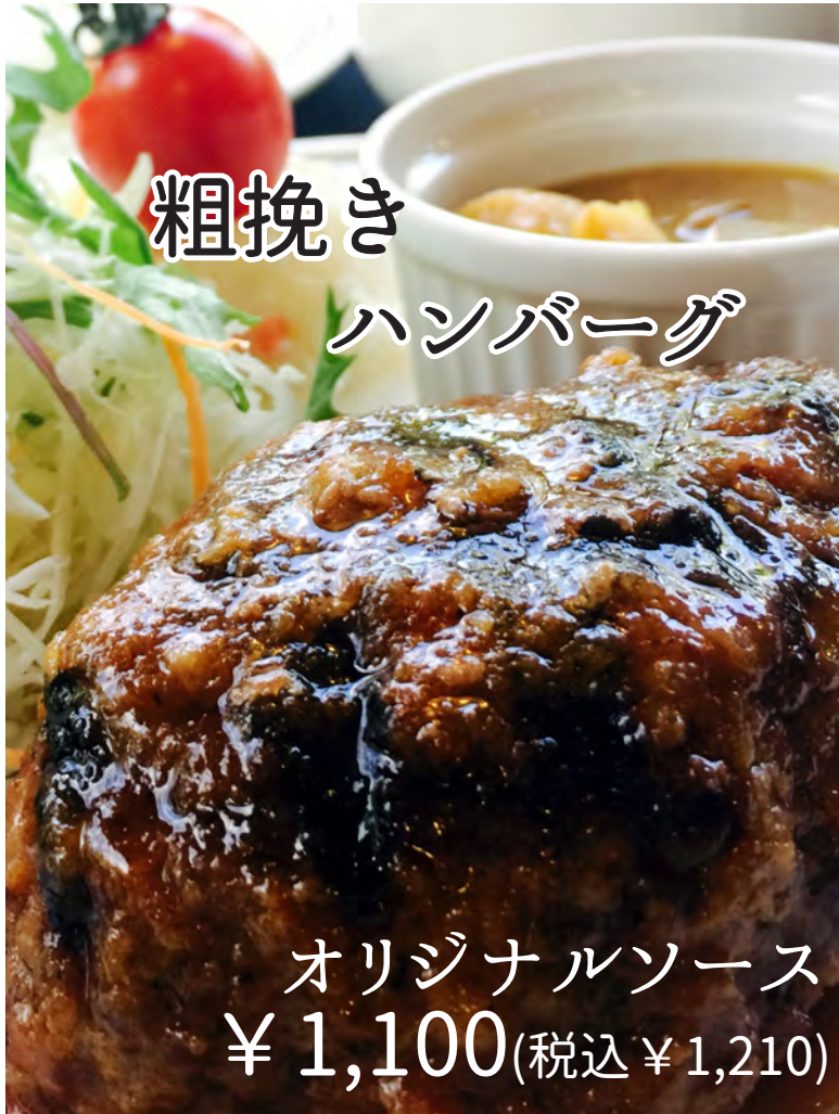
粗挽き ハンバーグ